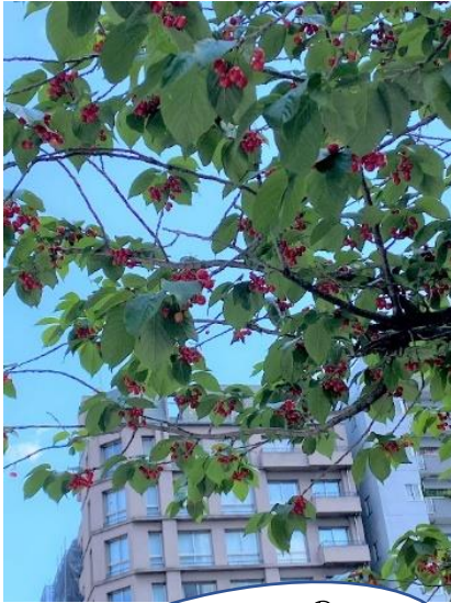
中央区明石町の サクランボが見事！！ 鳥達喜んでいました。