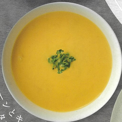
コーン・ジャガイモ・キャベツの クリームスープ